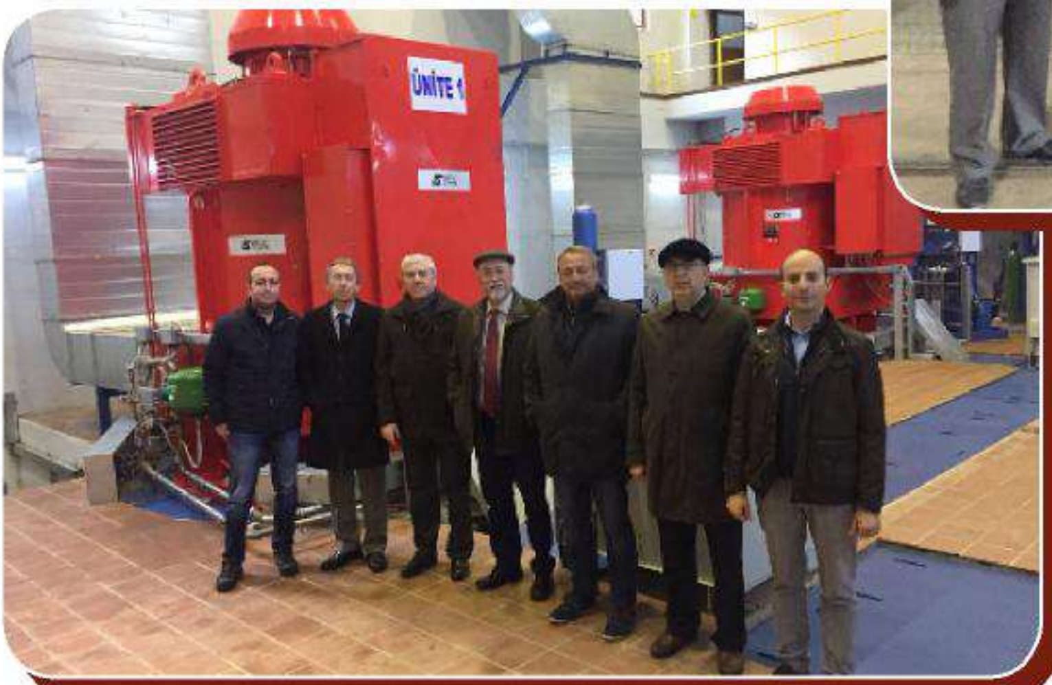
BND Elektrik Üretim A.Ş. - Ordu Üçgen 2 HES