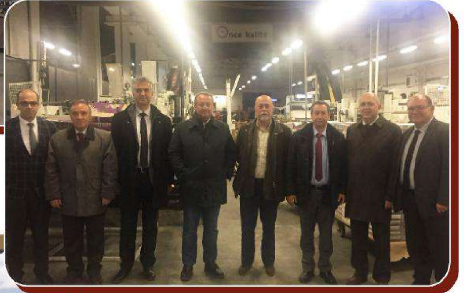
Işıklar Ambalaj Pazarlama A.Ş. Çumra Fabrikası