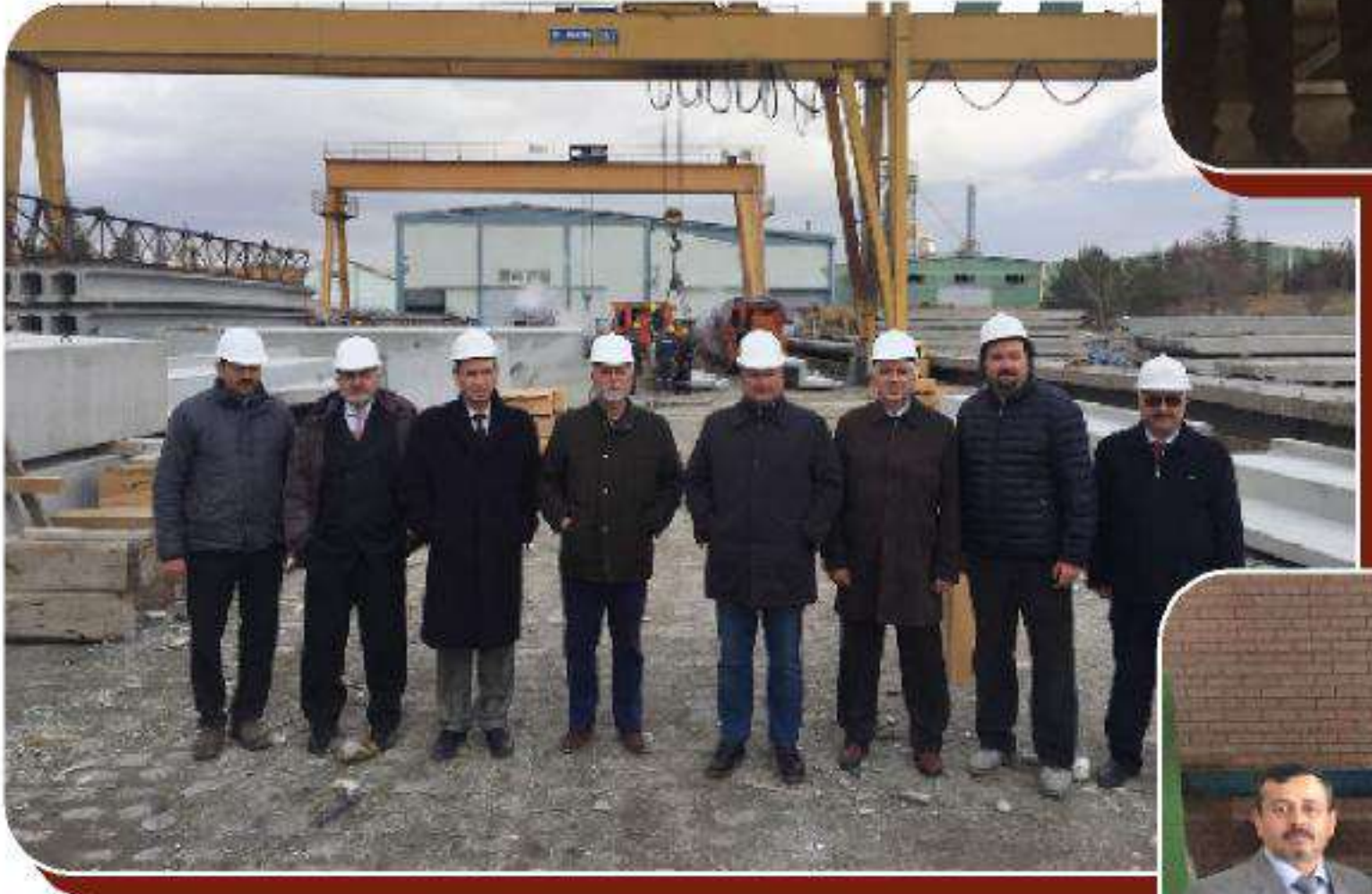
Niğbaş Niğde Beton Sanayi A.Ş.