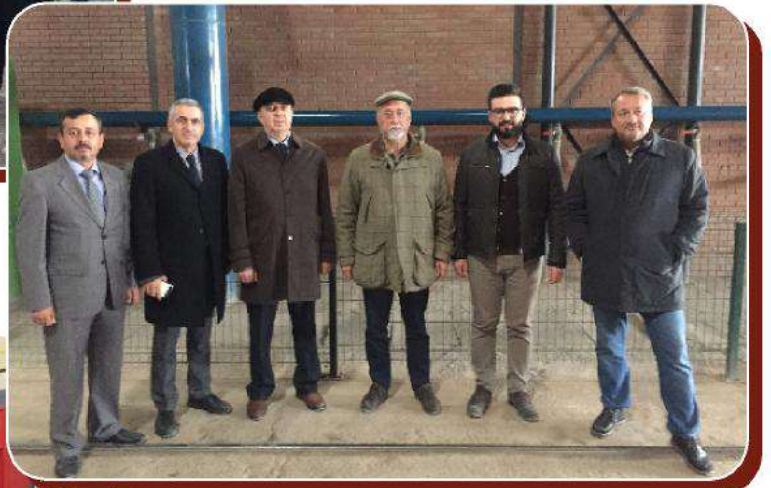
Işıklar İnşaat Malzemeleri San. ve Tic. A.Ş. - Bartın Fabrikası