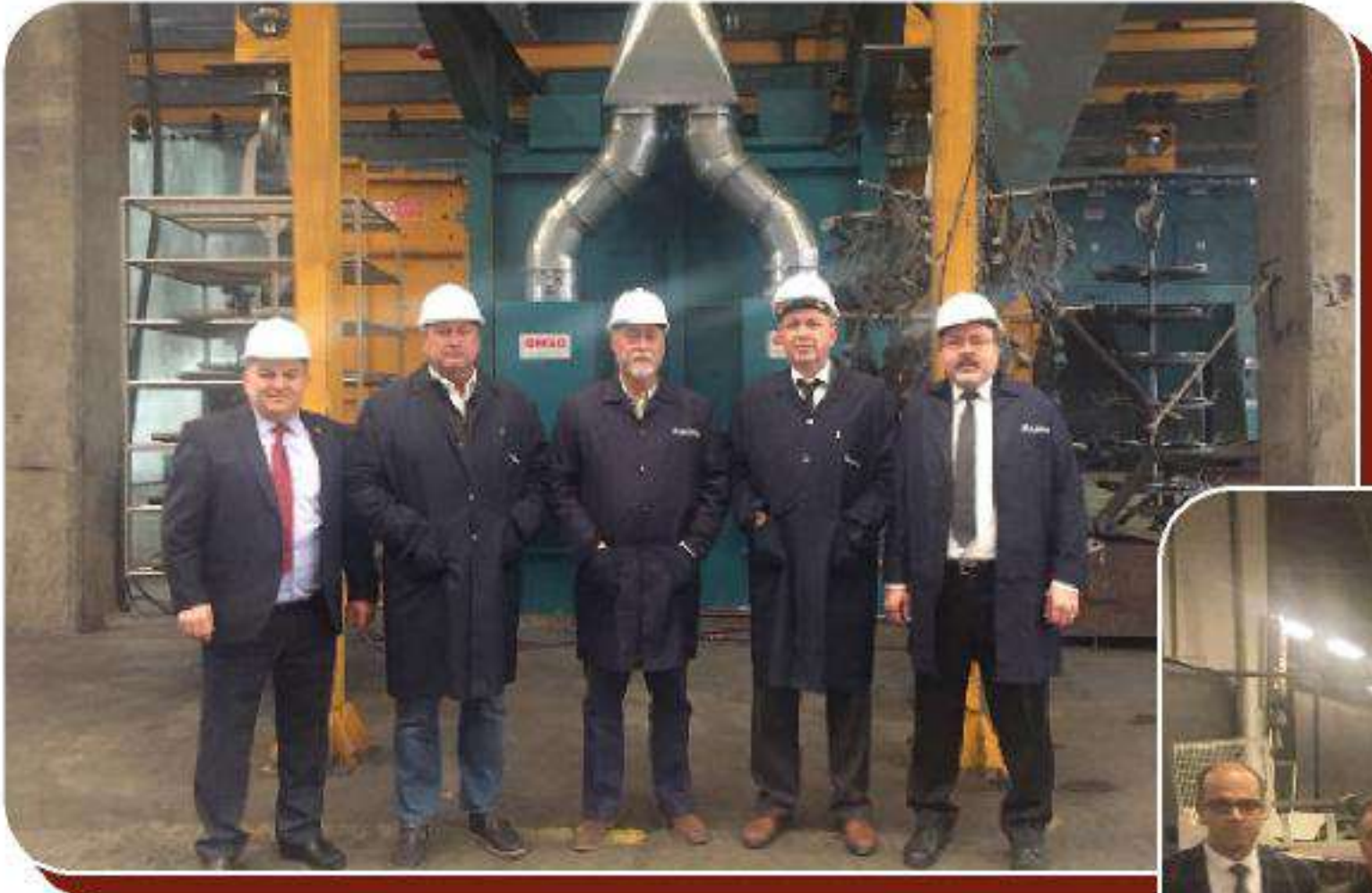
Çemaş Döküm Sanayi A.Ş. Kırşehir Fabrikası